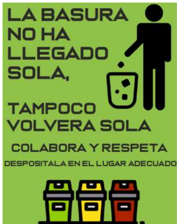
Carteles de prohibido tirar basura y prohibido caminar 30 minutos antes del inicio del primer participante (OPCIONALES)